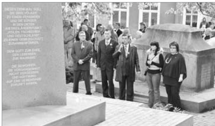
Oslavy Evropské pouti jsou součástí česko-polského projektu „Společnou cestou Trojzemím“, který je spolufinancován z prostředků ERDF prostřednictvím Euroregionu Nisa v rámci fondu malých projektů „Překračujeme hranice“.