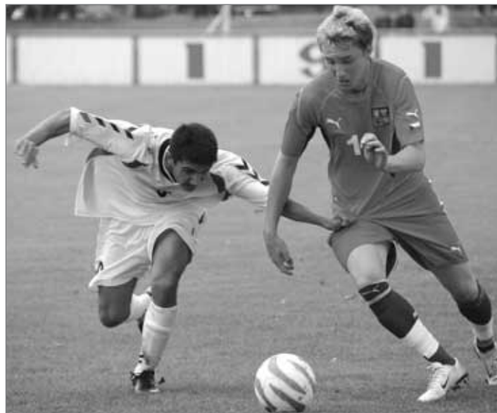
Hrádek hostil kvalifikační zápasy

Na začátku října hostil Hrádek reprezentační fotbalové týmy do 17 let. Česká republika si vítězstvím nad Arménií 5:1 zajistila postup do elitní části kvalifikace na Evropský šampionát 2008.